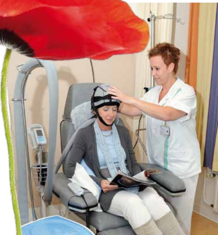
Veel patiënten ervaren haaruitval als een van de meest nare bijwerkingen van een chemokuur. Met hoofdkoeling via een cold-cap kan haaruitval soms aanzienlijk worden verminderd. Van een gedeelte van het gedoneerde geld is een aantal cold-caps aangeschaft.

Dit zijn gespecialiseerde verpleegkundigen die de patiënt persoonlijk begeleiden in het behandeltraject. “Voor patiënten is het niet fijn om ver weg te moeten. Vandaar dat we de specialistische zorg toch zoveel mogelijk in de buurt zoeken. Zo zijn we bijvoorbeeld een intensieve samenwerking aangegaan met het Catharina-ziekenhuis en Máxima Medisch Centrum.” De patiënt zelf blijft natuurlijk het allerbelangrijkst, zegt Jacobs. “We nemen de tijd om alles goed uit te leggen. De regie ligt bij de mensen zelf, maar wij zorgen wel dat afspraken, onderzoeken en ingrepen volgens protocol verlopen. Patiënten hoeven zich daar dan niet mee bezig te houden. Door dat stukje extra aandacht hopen we patiënten meer rust te geven. Zo kunnen ze zich zoveel mogelijk op hun ziekte richten en er op hun eigen manier mee omgaan.”